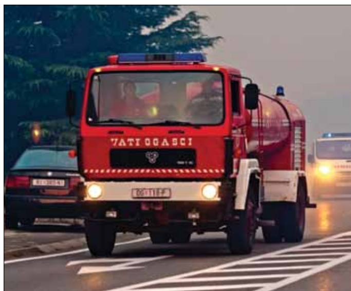
Dolazak vatrogasaca iz unutrašnjosti u noći 23. srpnja 2012.