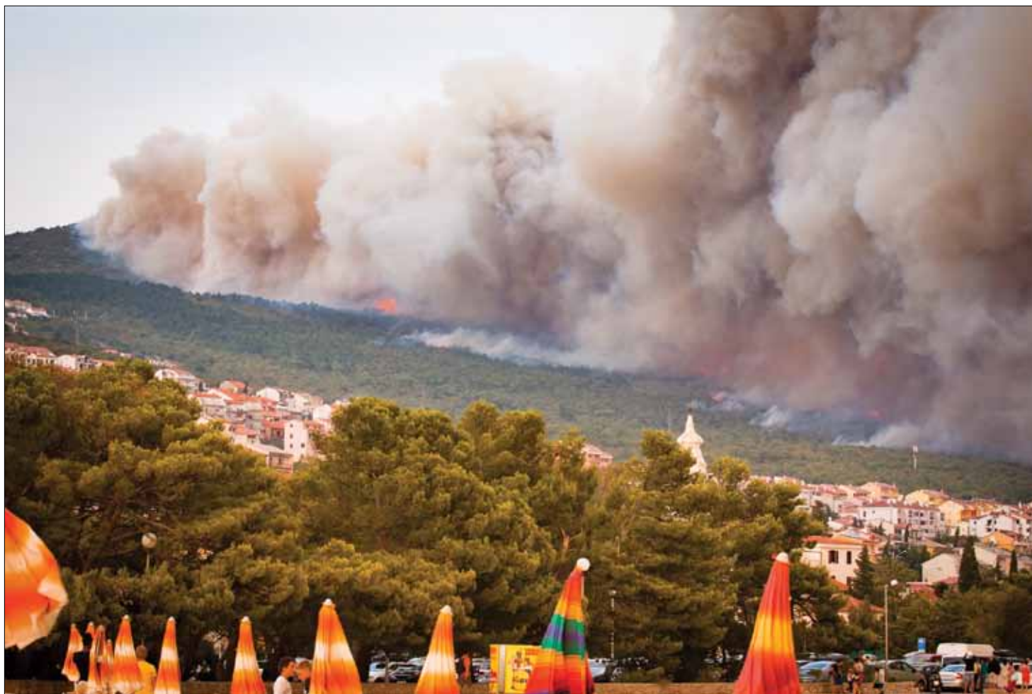
Požar nadomak Crikvenice i Selca 23. srpnja 2012.

Požar koji je 23. i 24. srpnja 2012. harao na području između Bribira, Selca i Crikvenice najveći je s kojim su crikvenički vatrogasci bili suočeni u stogodišnjem razdoblju svog postojanja. I ne samo to, požar je proglašen i najvećim u povijesti Crikvenice, grada koji je upravo 2012. godine slavio okruglu 600. godišnjicu postojanja. Toga 23. srpnja 2012. puhala je bura olujne jačine i već je od ranog jutra bilo vrlo „živo“ za crikveničke vatrogasce. Najprije su zajedno s drugim županijskim snagama ranom zorom upućeni na gašenje požara koji je bjesnio na otoku Rabu, međutim, dok su se vozili prema tražnom pristaništu, dobili su dojavu