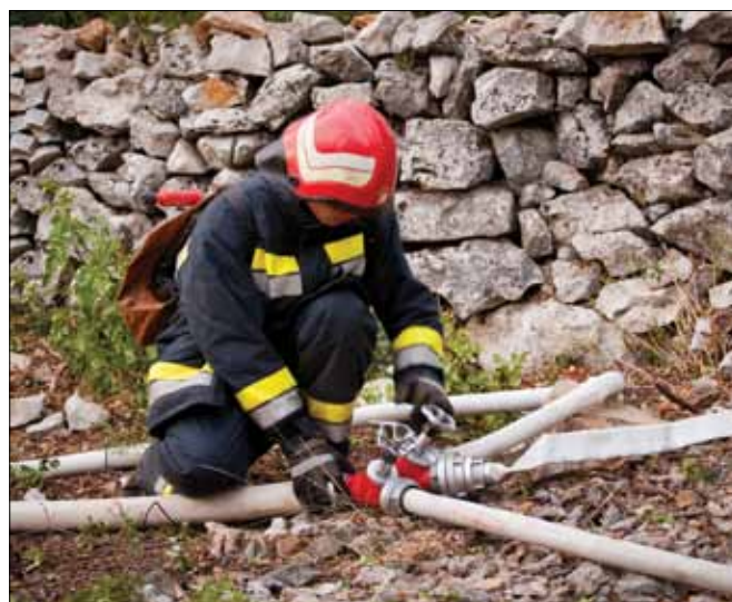
Vatrogasci su demonstrirali izuzetnu pripremljenost na teškom terenu