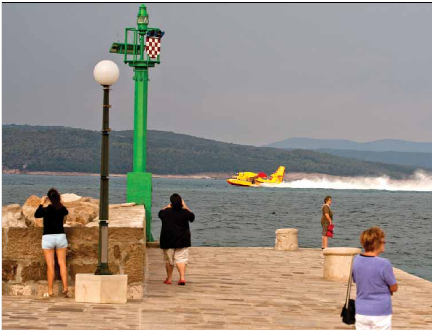
Kanader na moru ispred Vele palade - 24. srpnja 2012.