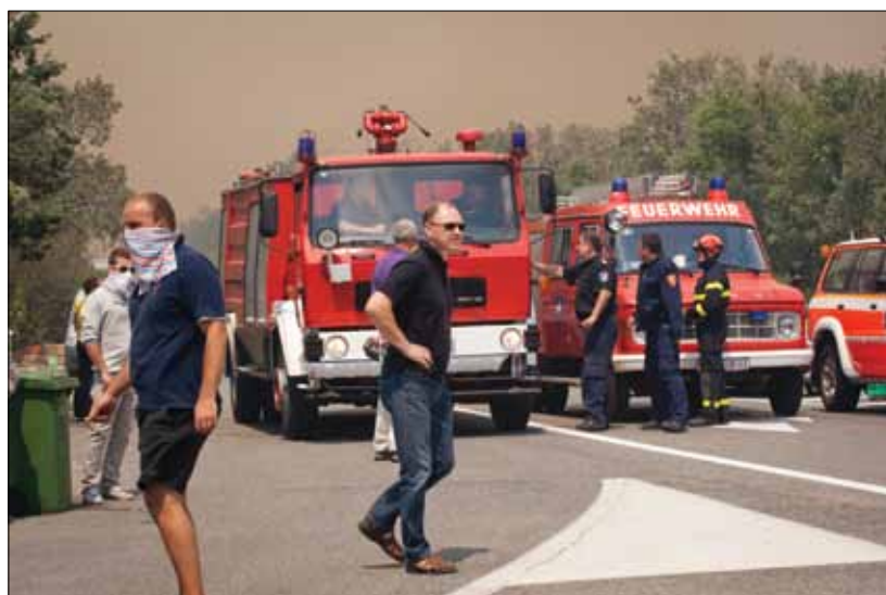
Promet Jadranskom magistralom je u potpunoj blokadi

Na požarištu je ostalo osiguranje naredna tri dana koje je od početnih 150 vatrogasaca smanjivano svakih 12 sati te završilo s 20 vatrogasaca.