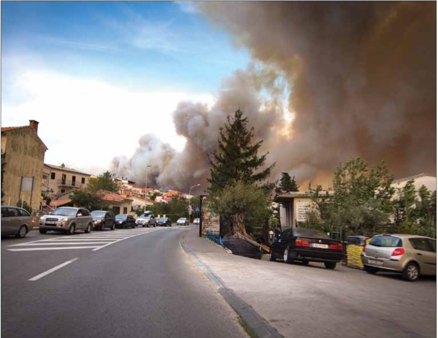
Crikvenica, 23. srpnja 2012. - pogled s benzinske crpke „Kaštel“