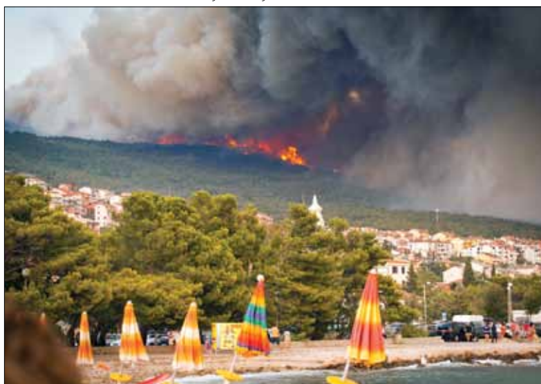
Vatra se spušta prema Jadranskoj magistrali