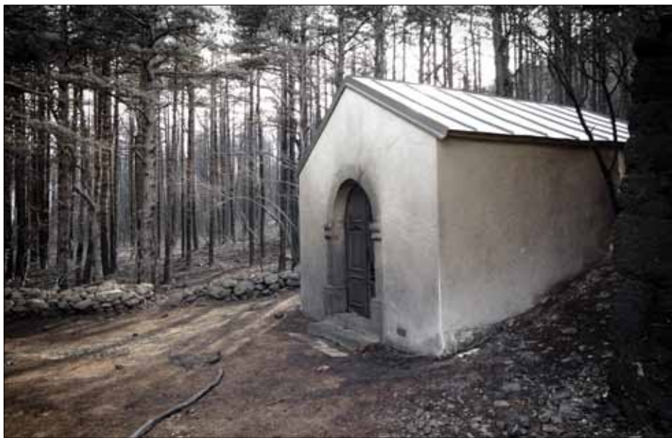
Kataklijmični prizori nakon požara

Od 16:00 „Hrvatske šume“ (6 vozila /47 ljudi), šumski radnici sjekači rade obrambene prosjeke između šumskog dijela i naselja.