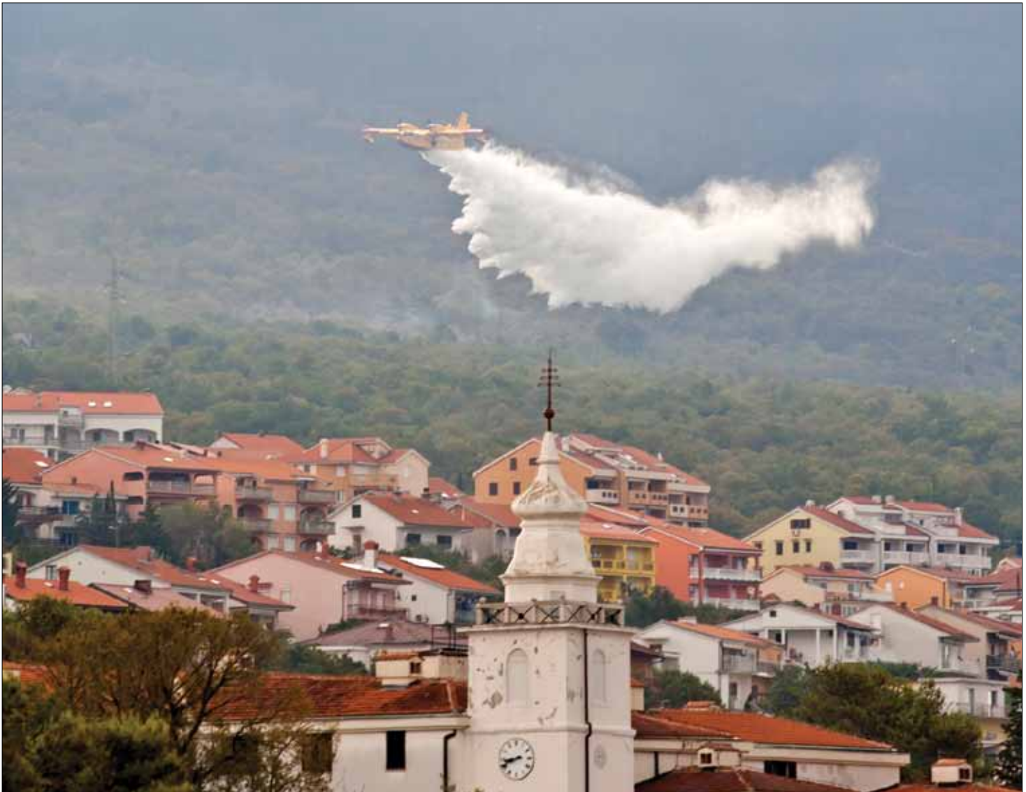
Kanader gasi požar blizu Zoričića - 24. srpnja 2012.