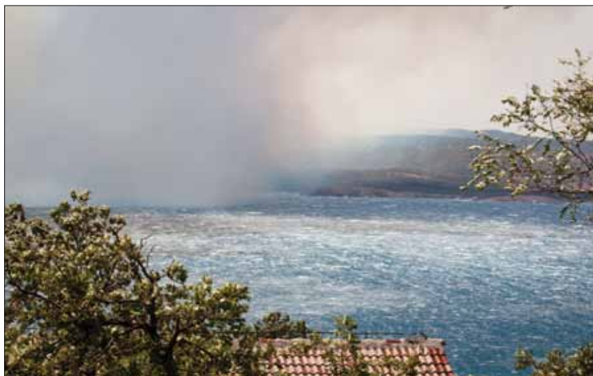
Olujna bura otežavala je gašenje požara

U 16:00 županijski vatrogasni zapovjednik proglašava V. stupanj Operativnog plana za područje Crikveničko-vinodolskog operativnog područja.