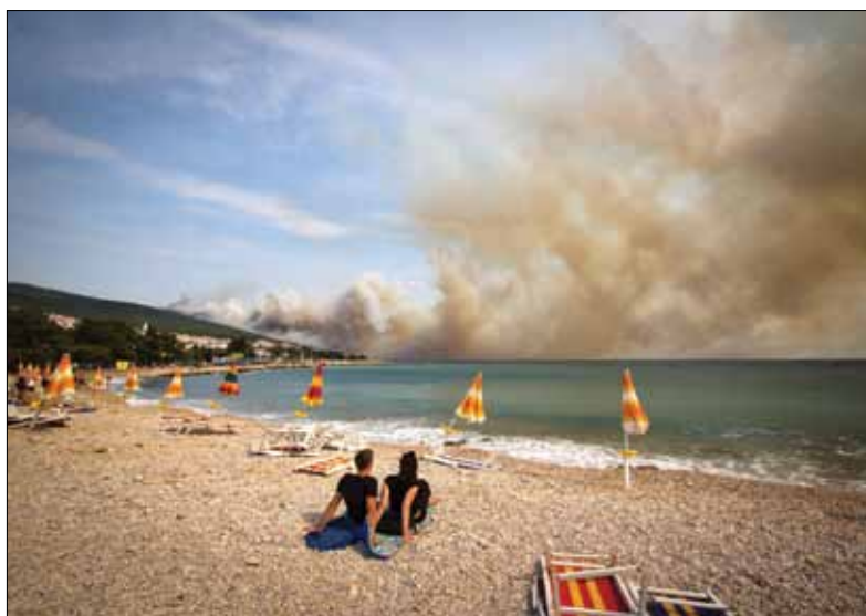
Prizor kakav turisti sigurno nisu očekivali 23. srpnja 2012. u jutarnjim satima

Naglom promjenom smjera vjetra požar koji je ugrožavao magistralu, počinje se velikom brzinom širiti na potezu kamenolom „Izgradnja“ – Sv. Barbara te zahvaća kompleks borovine i prebacuje cestu Selce – Bribir