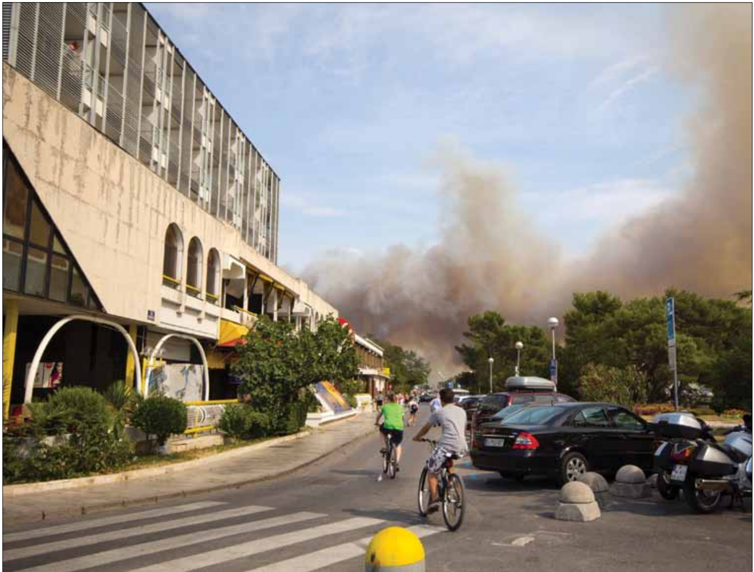
Crikvenica, 23. srpnja 2012. - pogled s Trga Stjepana Radića