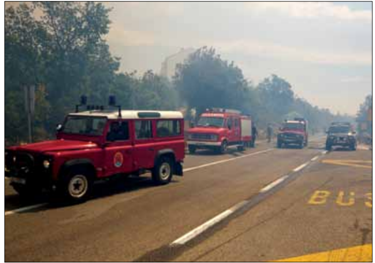
Linija obrane od požara priječila je širenje vatre