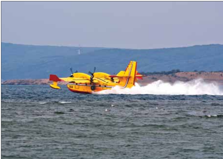
Požar je ugašen uz pomoć kanadera