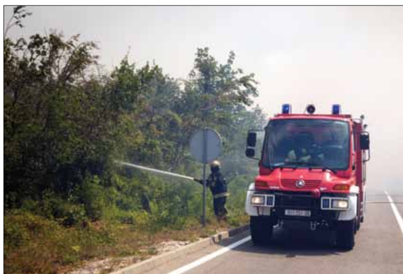
Trebalo je obraniti da vatrena stihija ne prijede magistralu