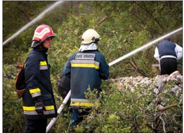
Borba protiv vatrene stihije