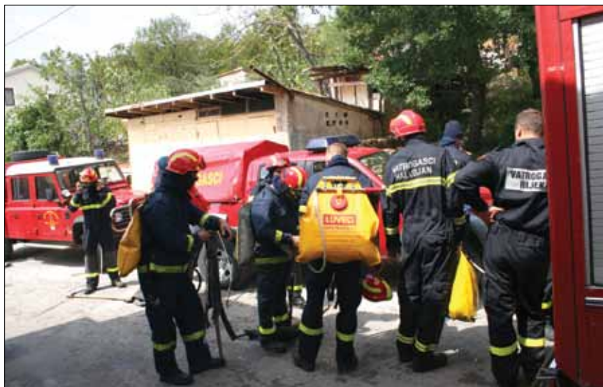
Vatrogasci iz cijele Županije pristigli su gasiti požar