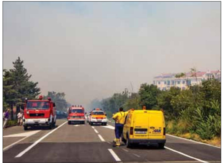
Jadranska magistrala u ponedjeljak, 23. srpnja 2012. ujutro