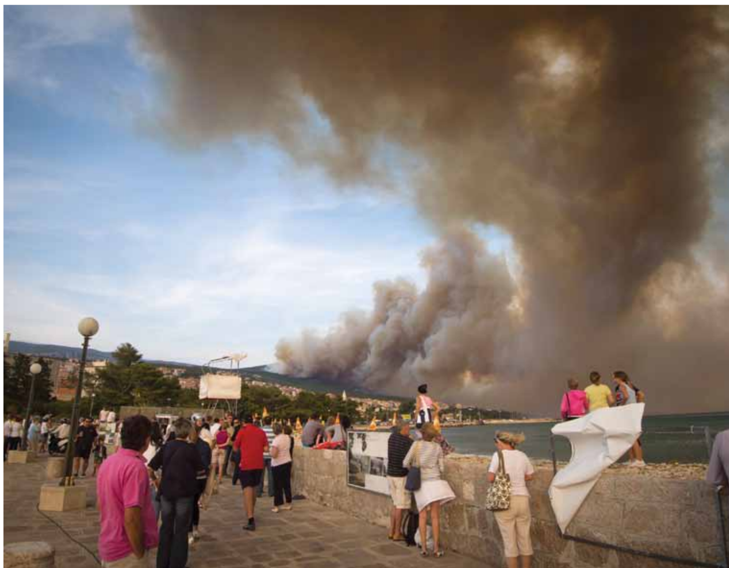
Crikvenica, 23. srpnja 2012. - pogled s Vele palade