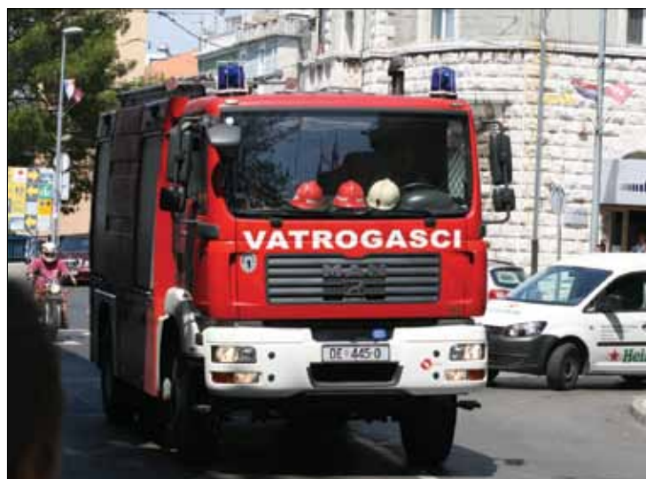
Brojna vatrogasna vozila na crikveničkim ulicama