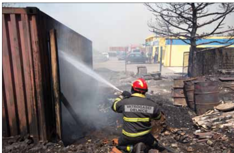
Gašenje požara u skladištu „Rabkomerca“