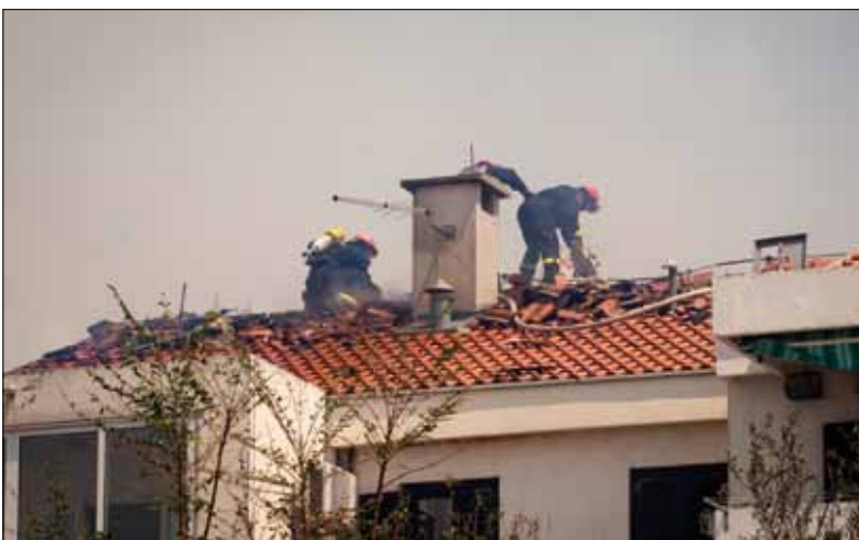
Gašenje požara na krovu zgrade u naselju Studenčić