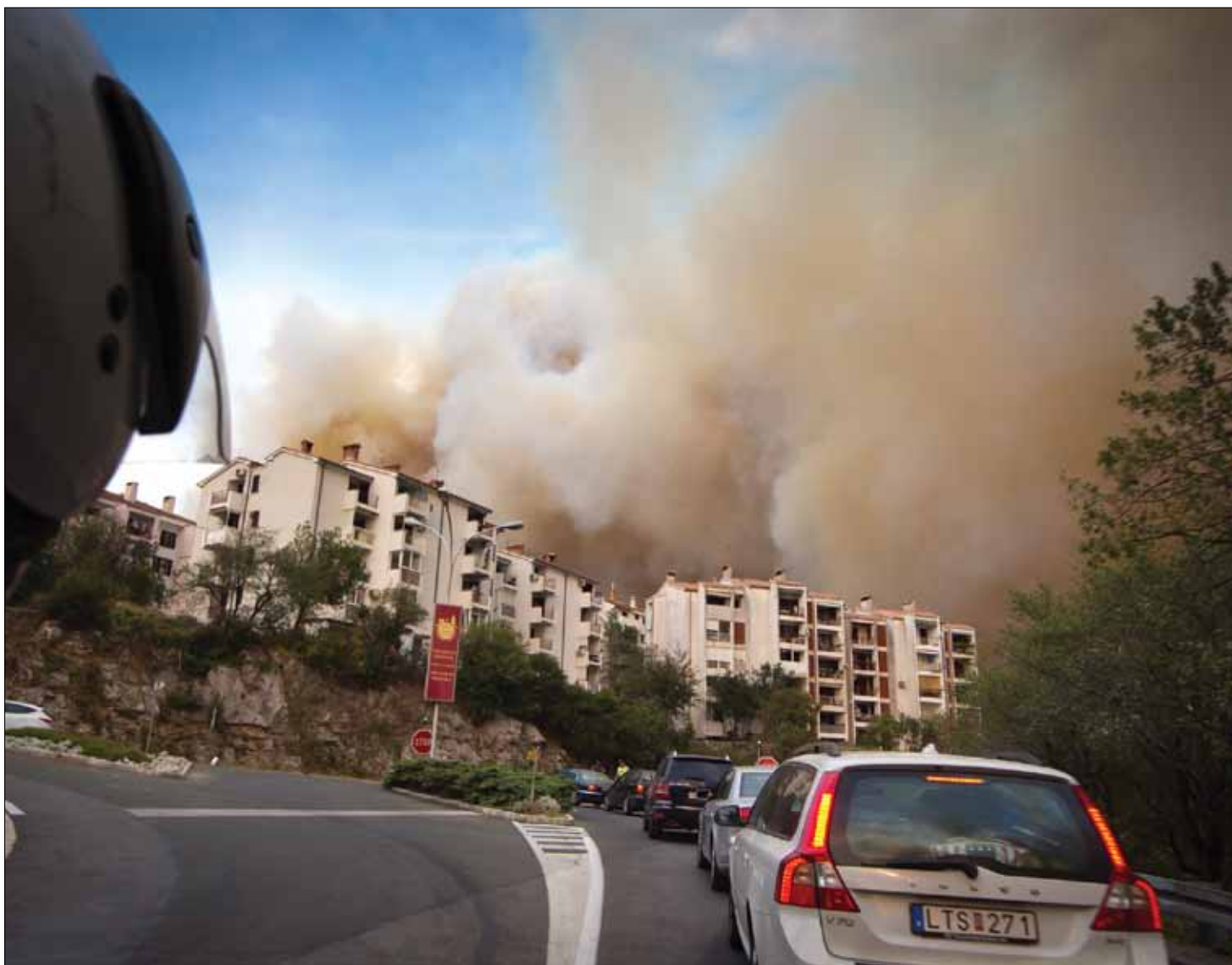
Crikvenica, 23. srpnja 2012. - izlaz na magistralu ispod Hrute