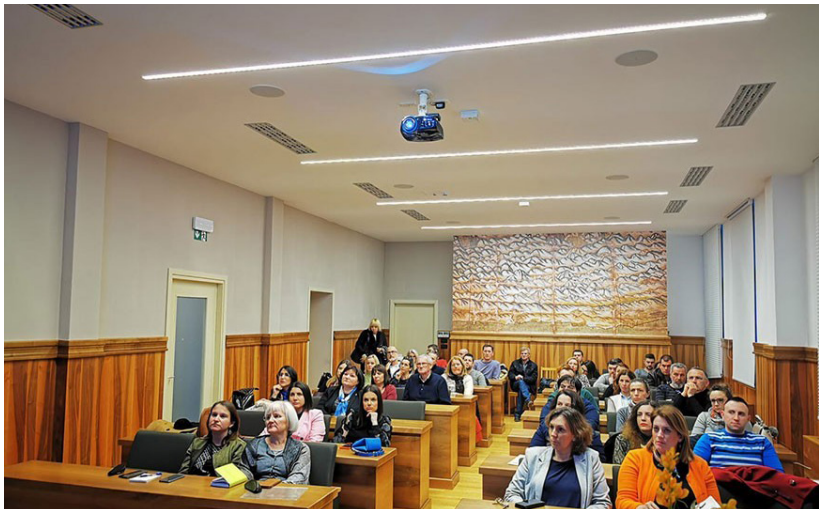
Za edukacije u sklopu projekta u Gradskoj se vijećnici tražila „stolica više“.